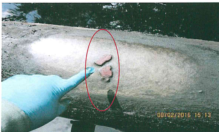
Imagen N° 2

Se muestra el desgaste y/o deterioro que ha sufrido la tubería por efectos de corrosión severa, los dos puntos muestran el estado inicial de la tubería.