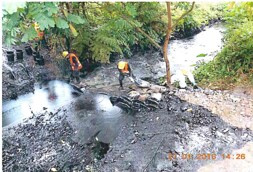
Se observa el desplazamiento del petróleo crudo derramado, el mismo que sigue el curso de la quebrada Inayo. Asimismo, se observa labores para contener el producto derramado.